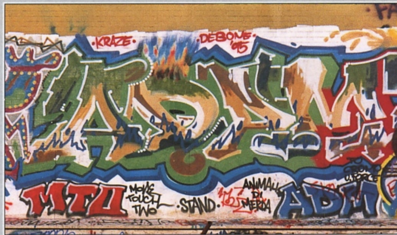
"ADAM" MT2 ROMA