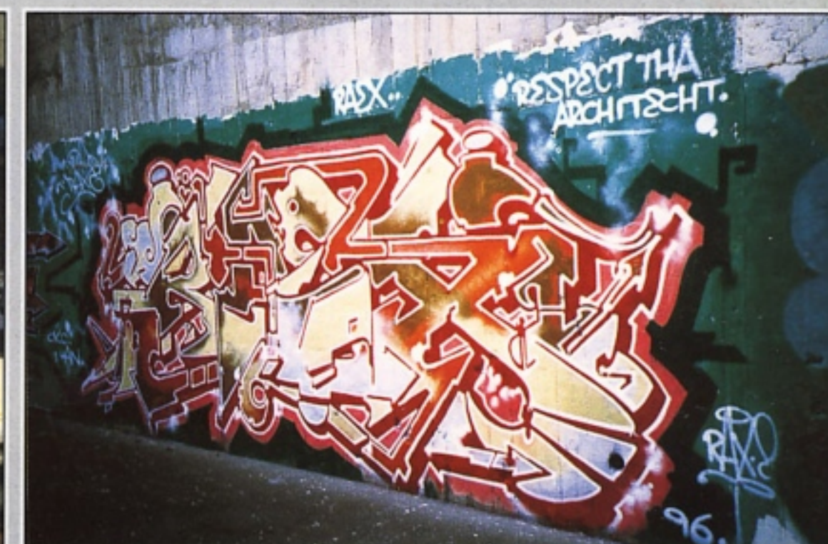
"RAX.E" CKC.UAN.IVA MILANO