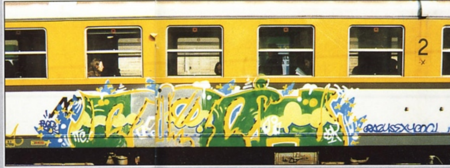
"CLOK" THP MILANO