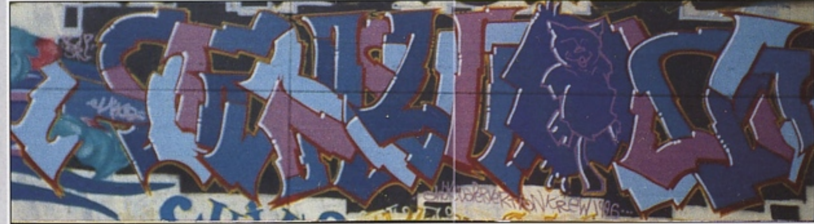
"DONCHIKO" ADP.SPF BERGAMO