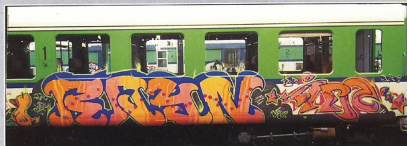
"BIN2" TAK.GR MILANO