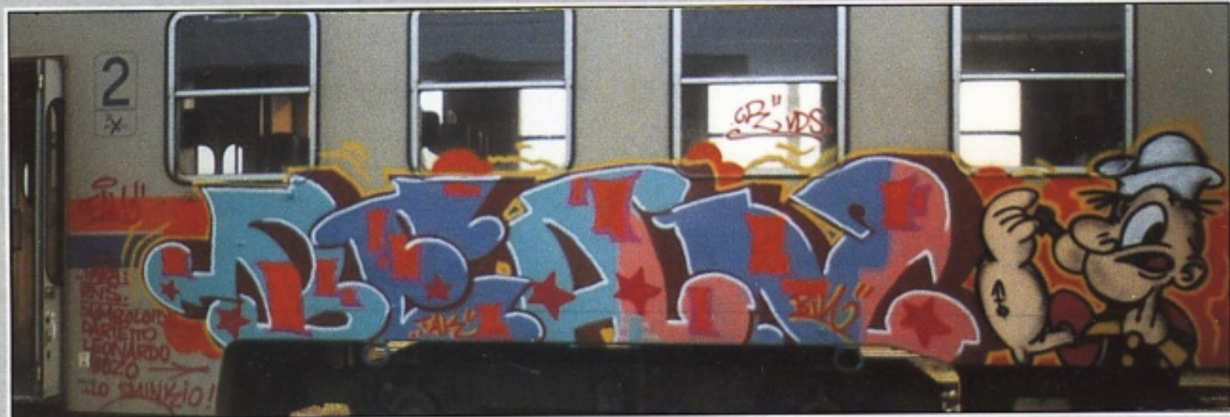
"BIN2" TAK.GR MILANO