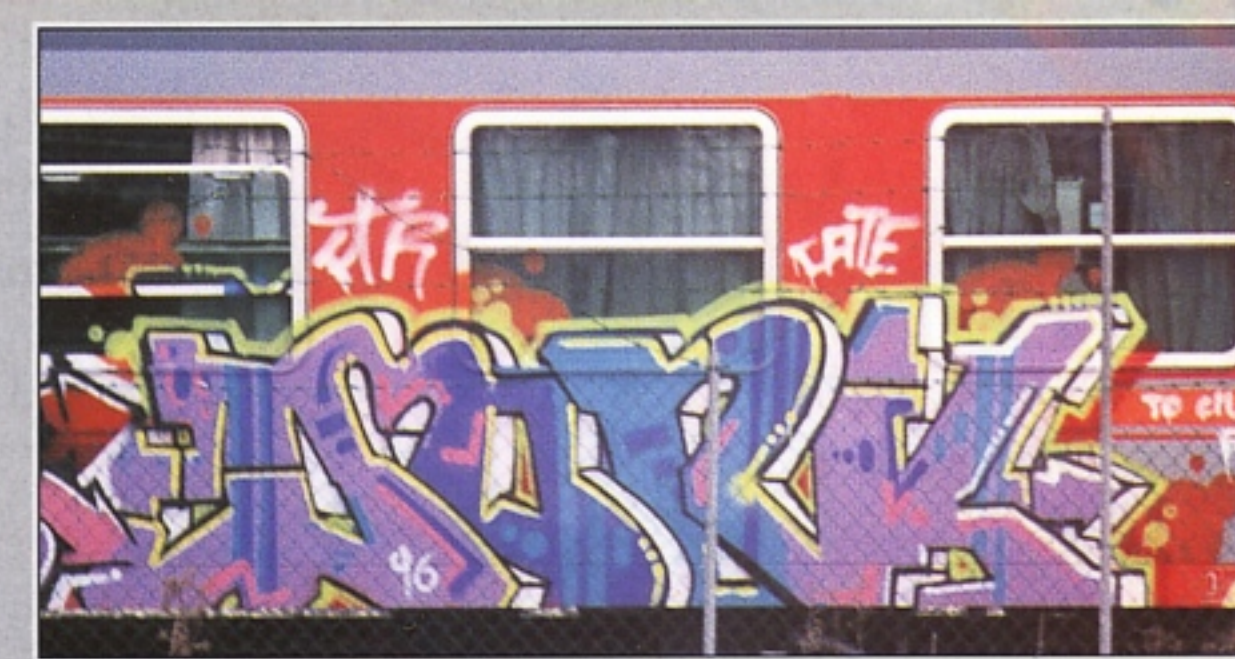
"DORK" FTR. FIRENZE