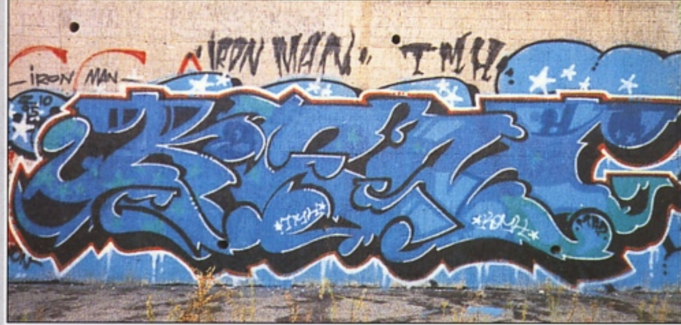
"KEMH" TMH ROMA