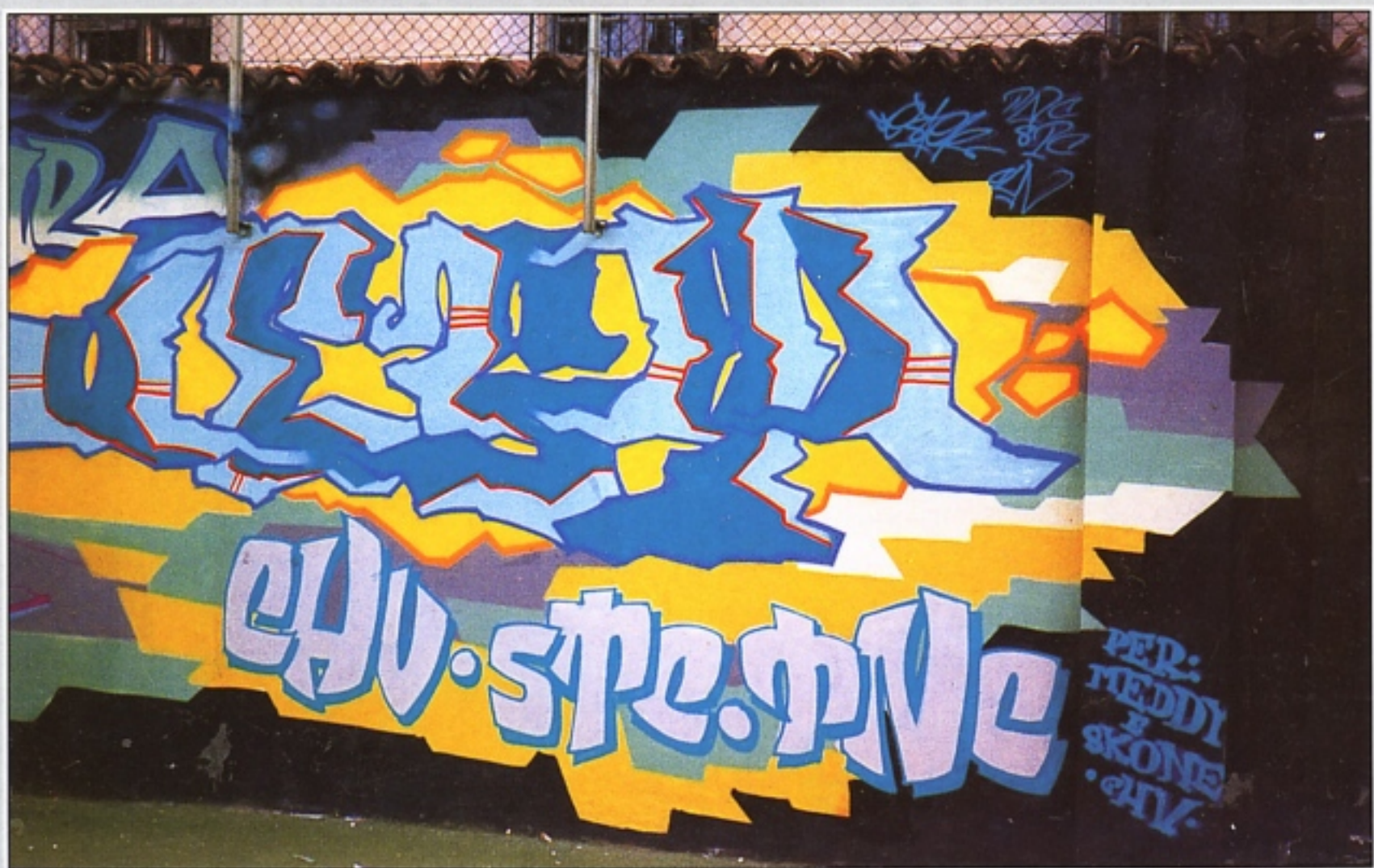
"JESTER" TNC-CHV CREMA