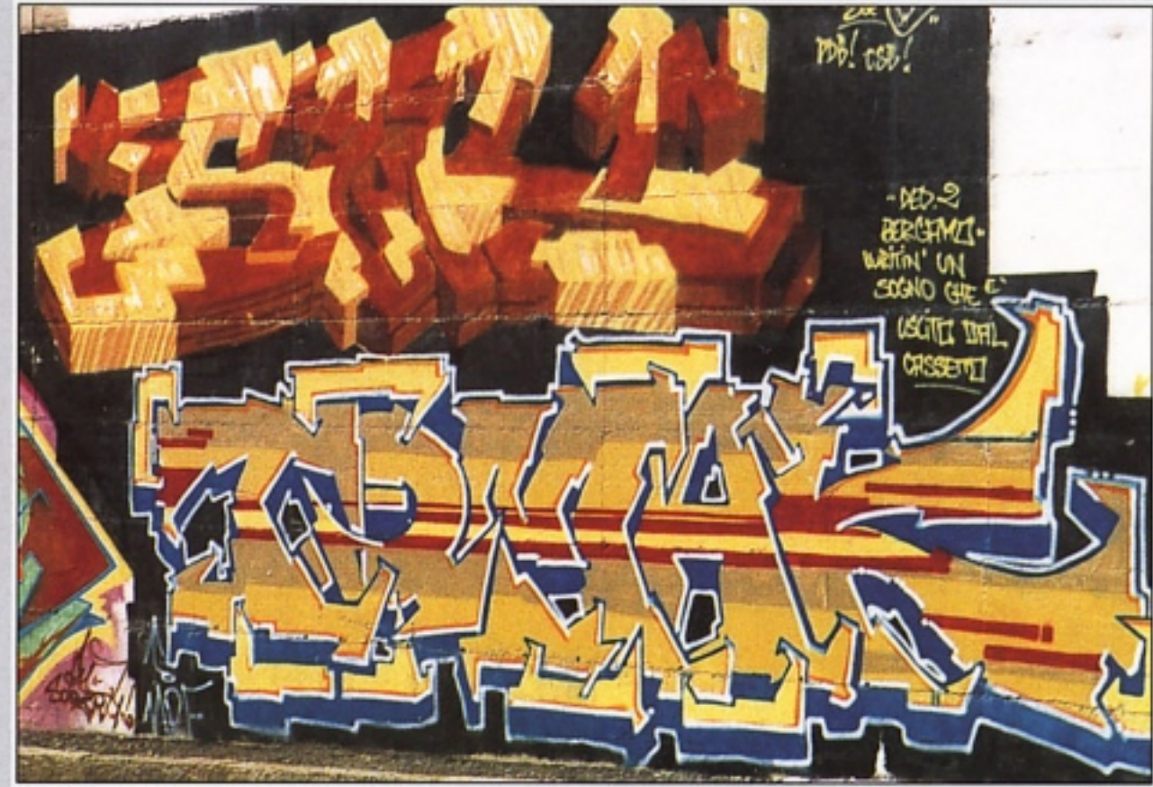
"SIR" + "TOMAK" A HIPOTA