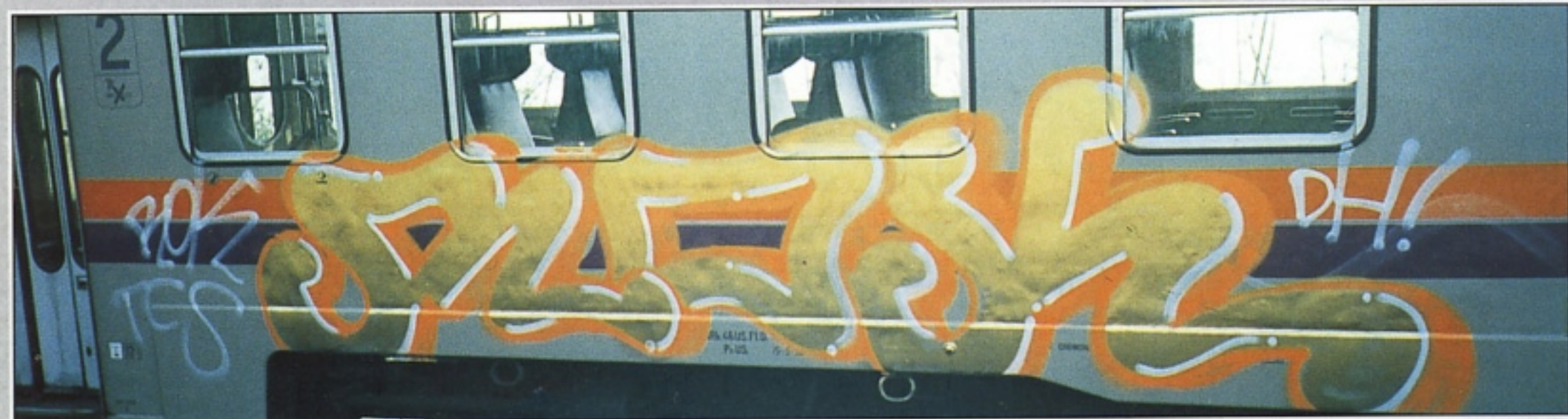
"ROK" TCS PIACENZA