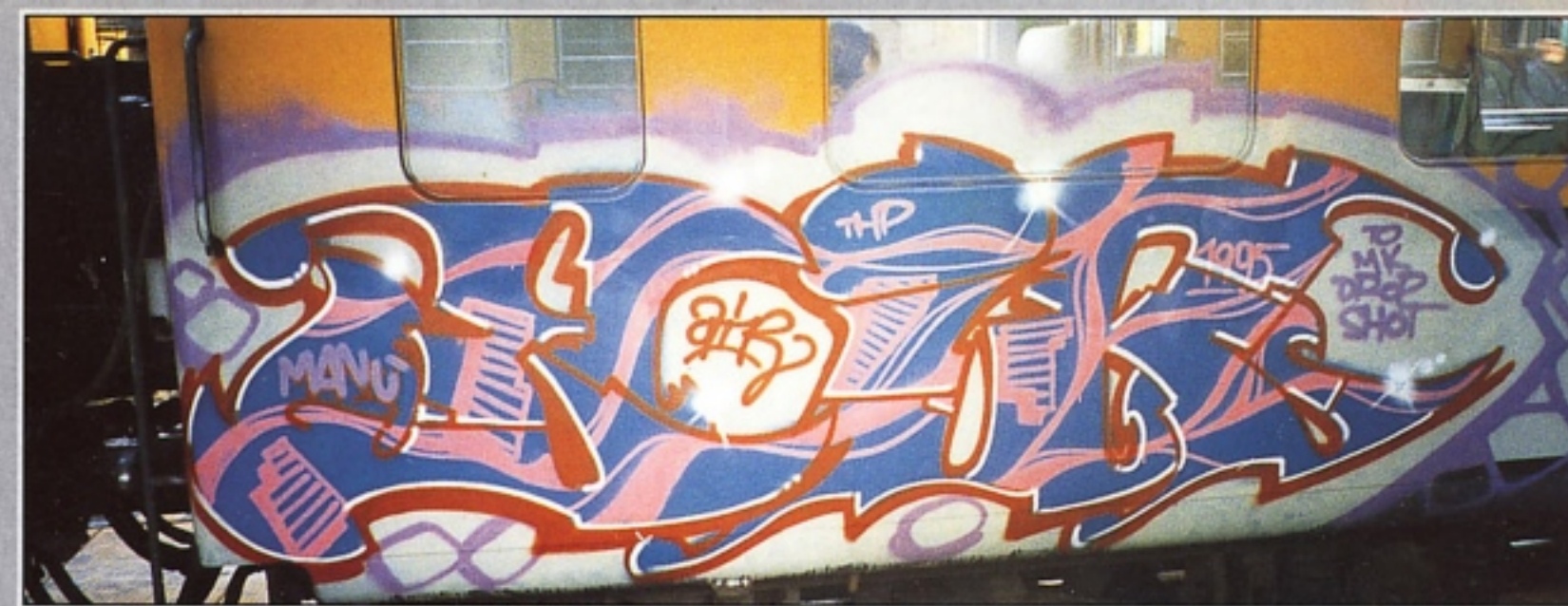
"AIRONE" THP MILANO