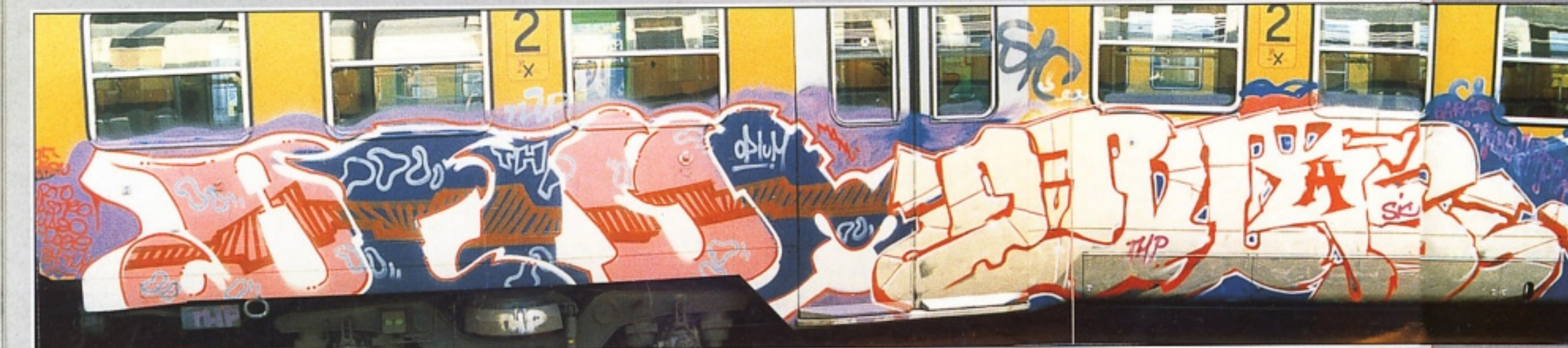
"OPIM" + "MASTRO-K" THP MILANO