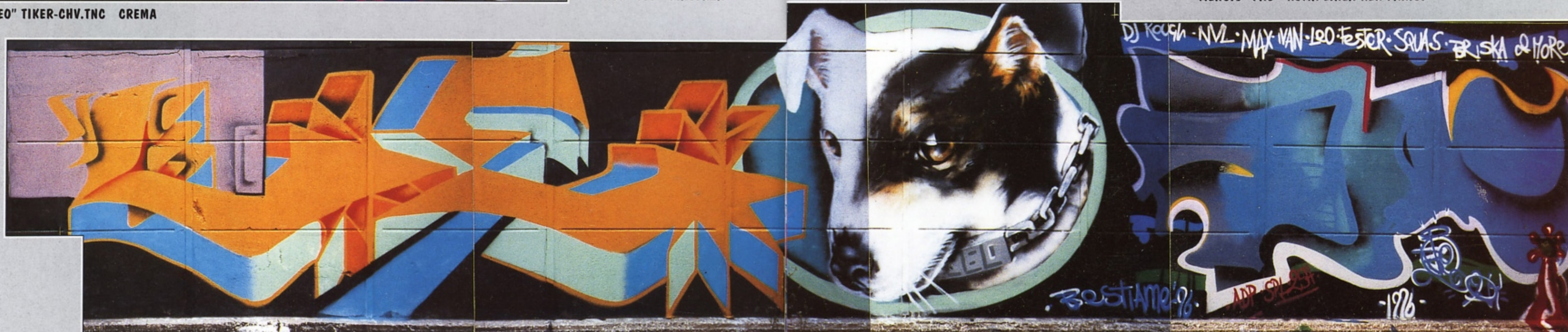
"LEO" + "BIE" BAP BRESCIA

DJ KOUGH - NVL - MAX VAN - LEO - FOSTER - SOULS - BRISKA & MORE