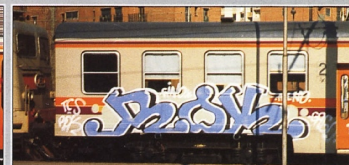
"ROK" TCS PIACENZA