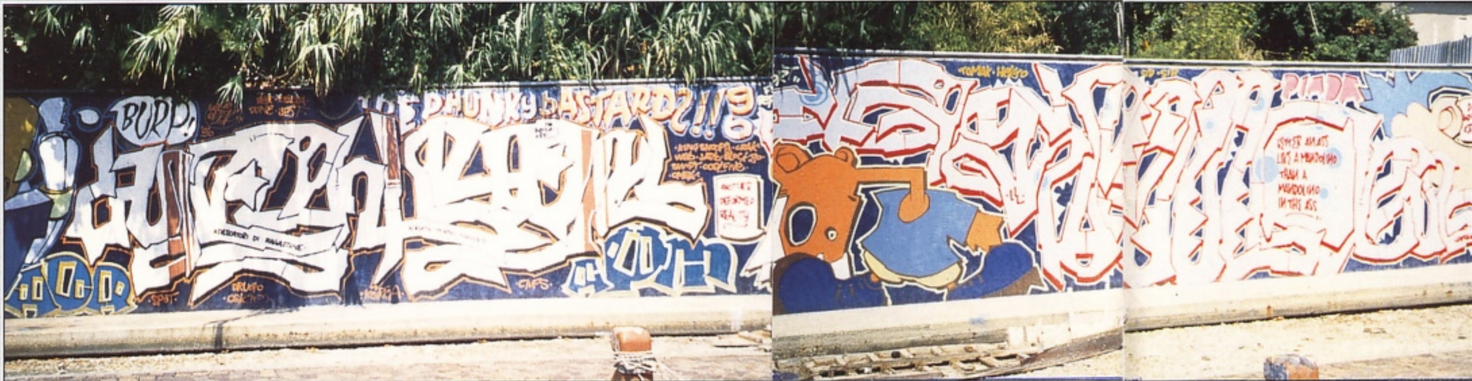
"LEGO" ADR RIMINI