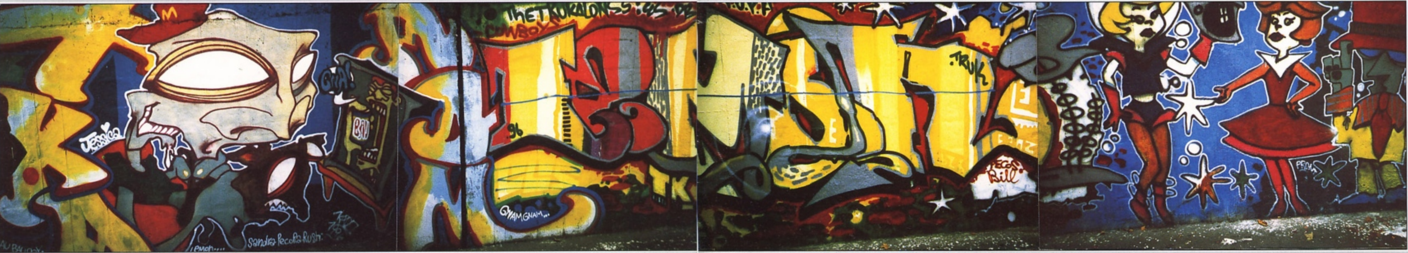
"LEMON" + "KADO" TKA MILANO