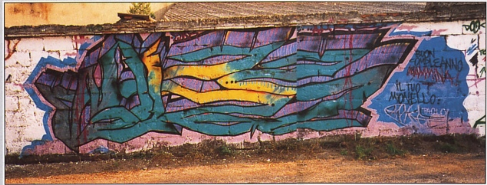
"AHKS" RST CREMA