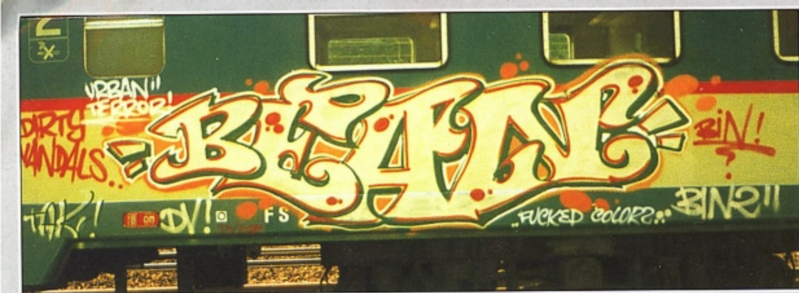
"BIN2" TAK.GR MILANO