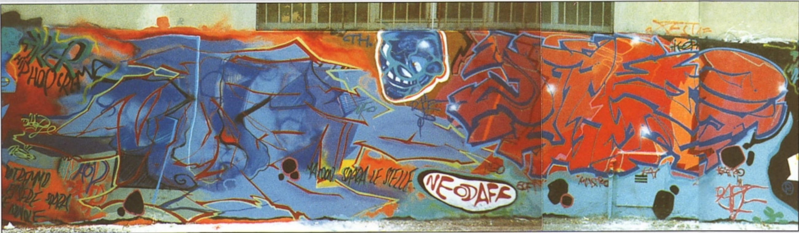
"NEO" + "DAFF" TIKER CREMA