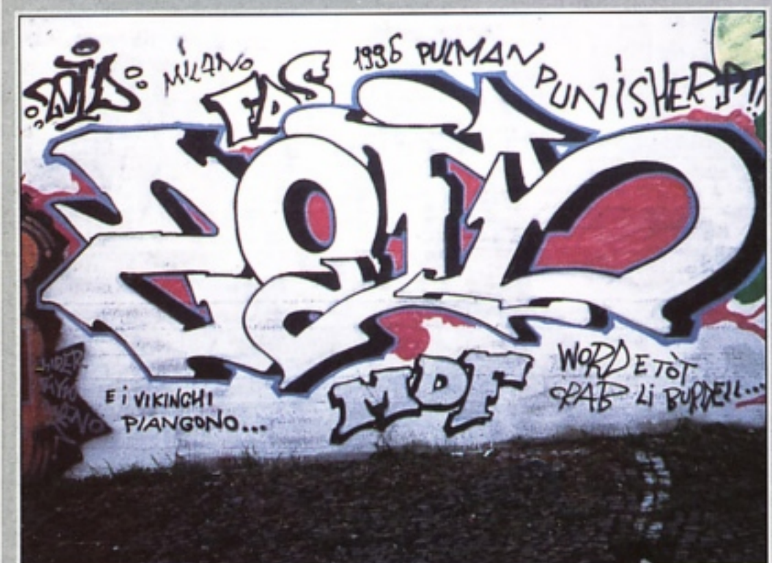
"ZOID" MDF.FDS MILANO A RIMINI