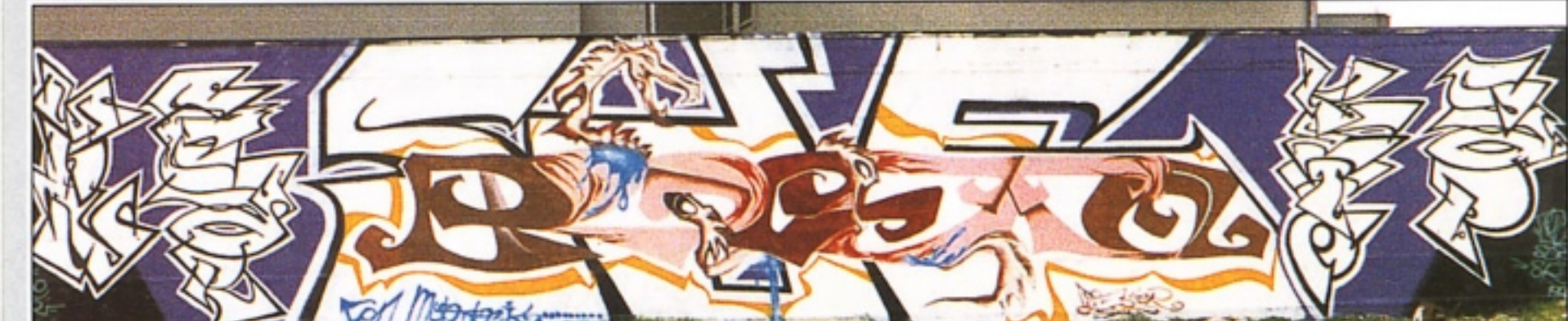
"MUN" + "CAP" + "KETO" + "SCAR" SDE LOCATE