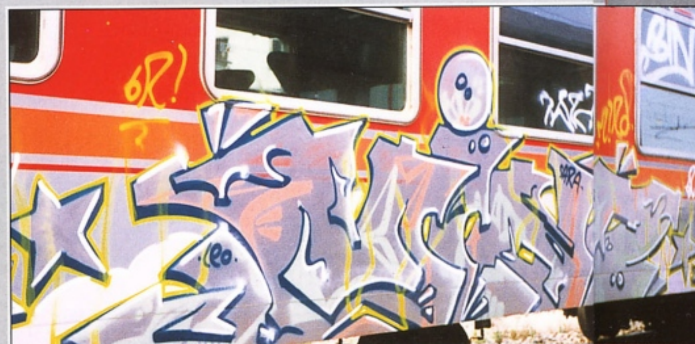
"MIND" TAK.GR MILANO