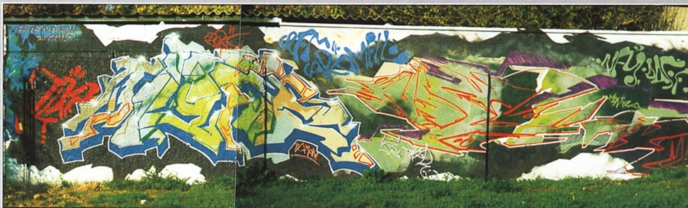
"DAFF" + "NEO" TIKER CREMA