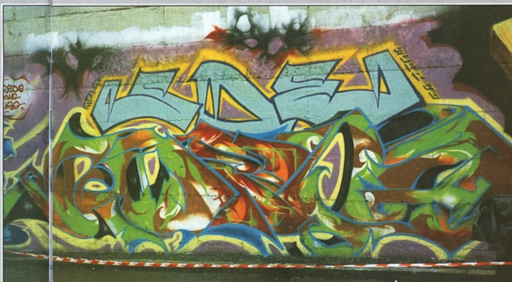
"CAP" SDE LOCATE A HIPOTA