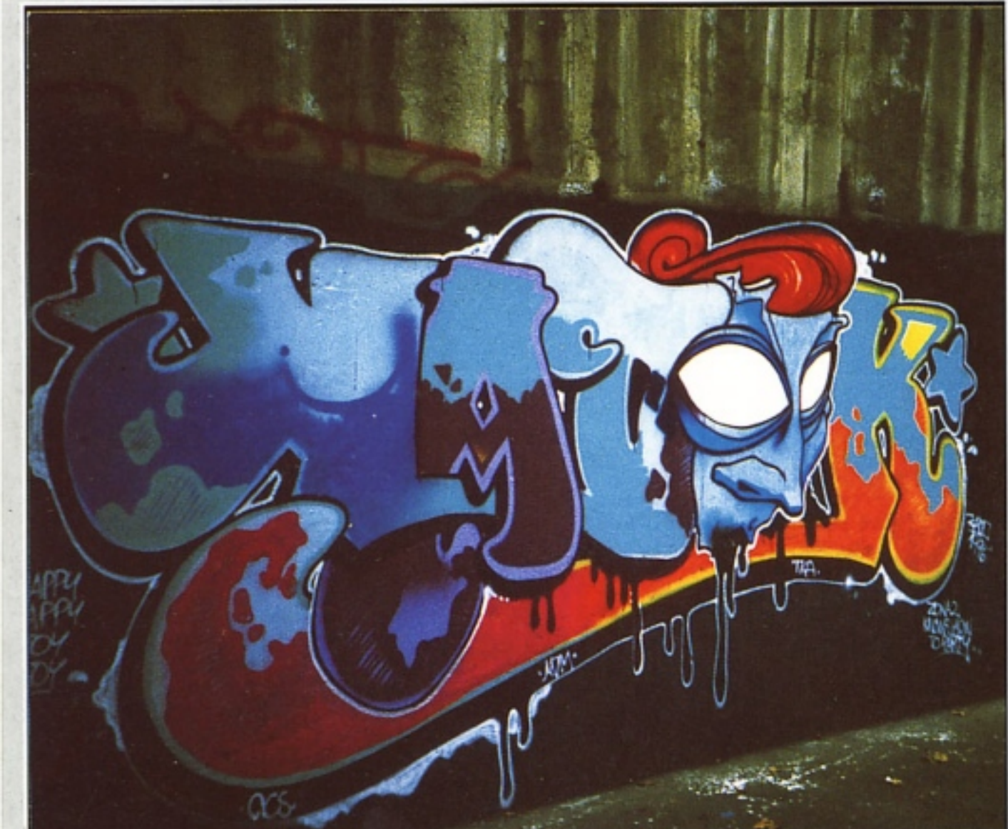
"KADO" TKA MILANO