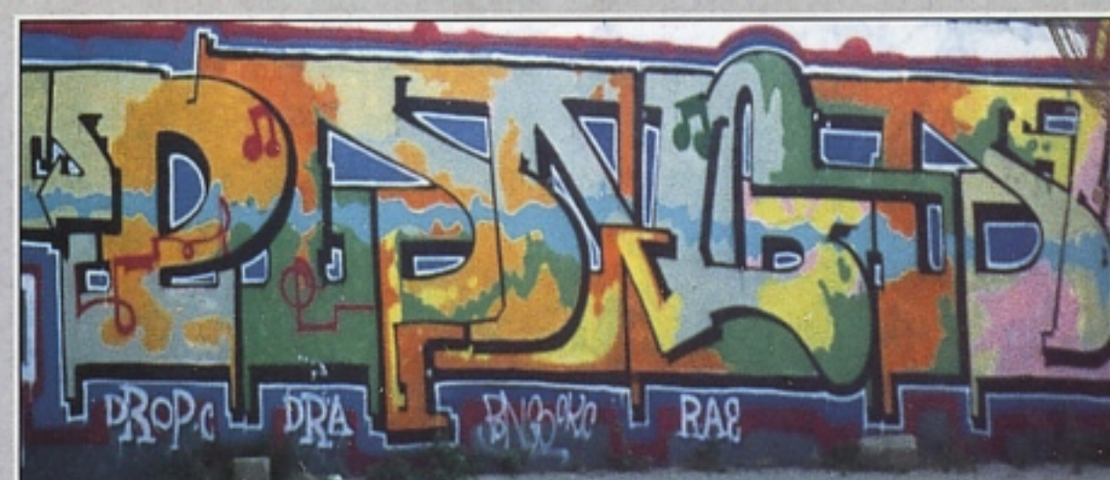
"PONGO" CKC MILANO