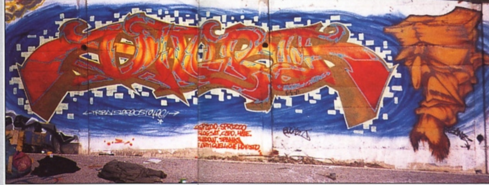
"BOOST" UDINE A JUICE