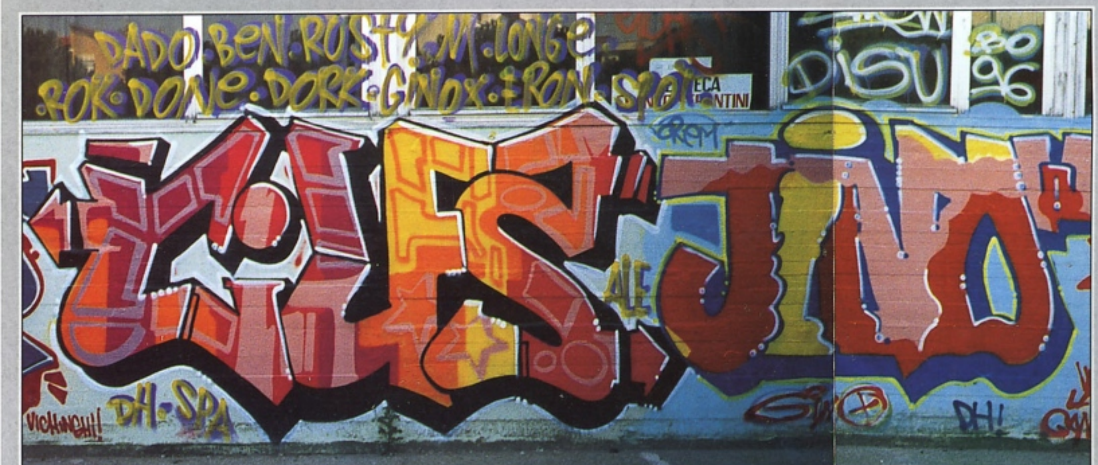
"CIUFS" SPA DH + "GINOX" DH BOLOGNA A PISA