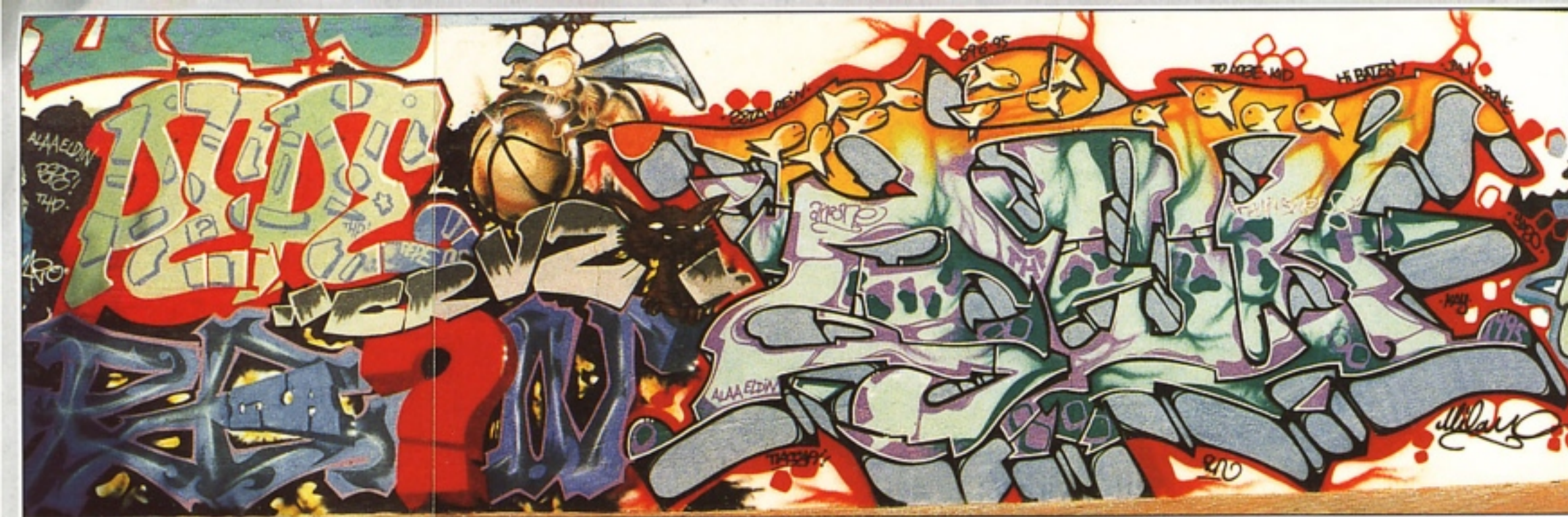
"YAZO" THP + "REYN" TAK.GR + "AIRONE" THP MILANO