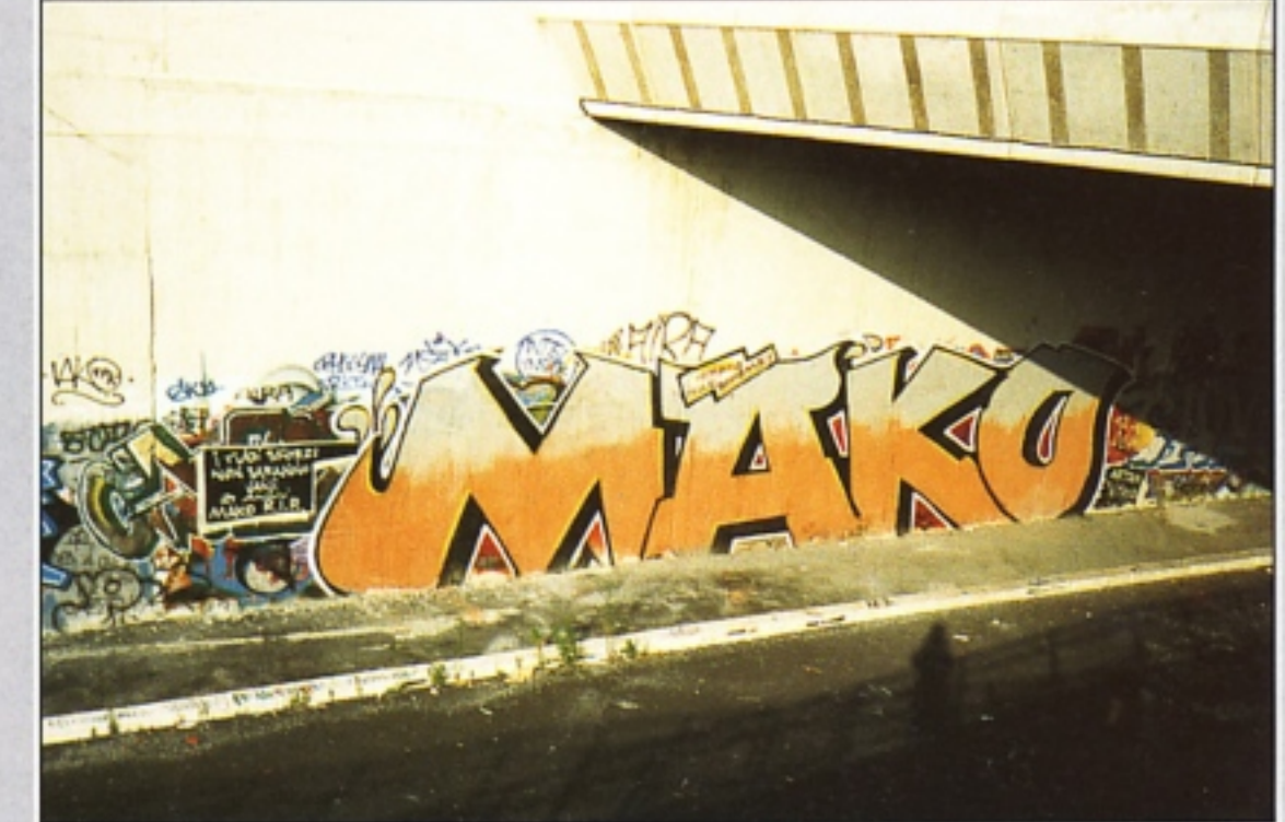
"NITRO" . "ARTAN" OCP-TMH memorial MAKO ROMA