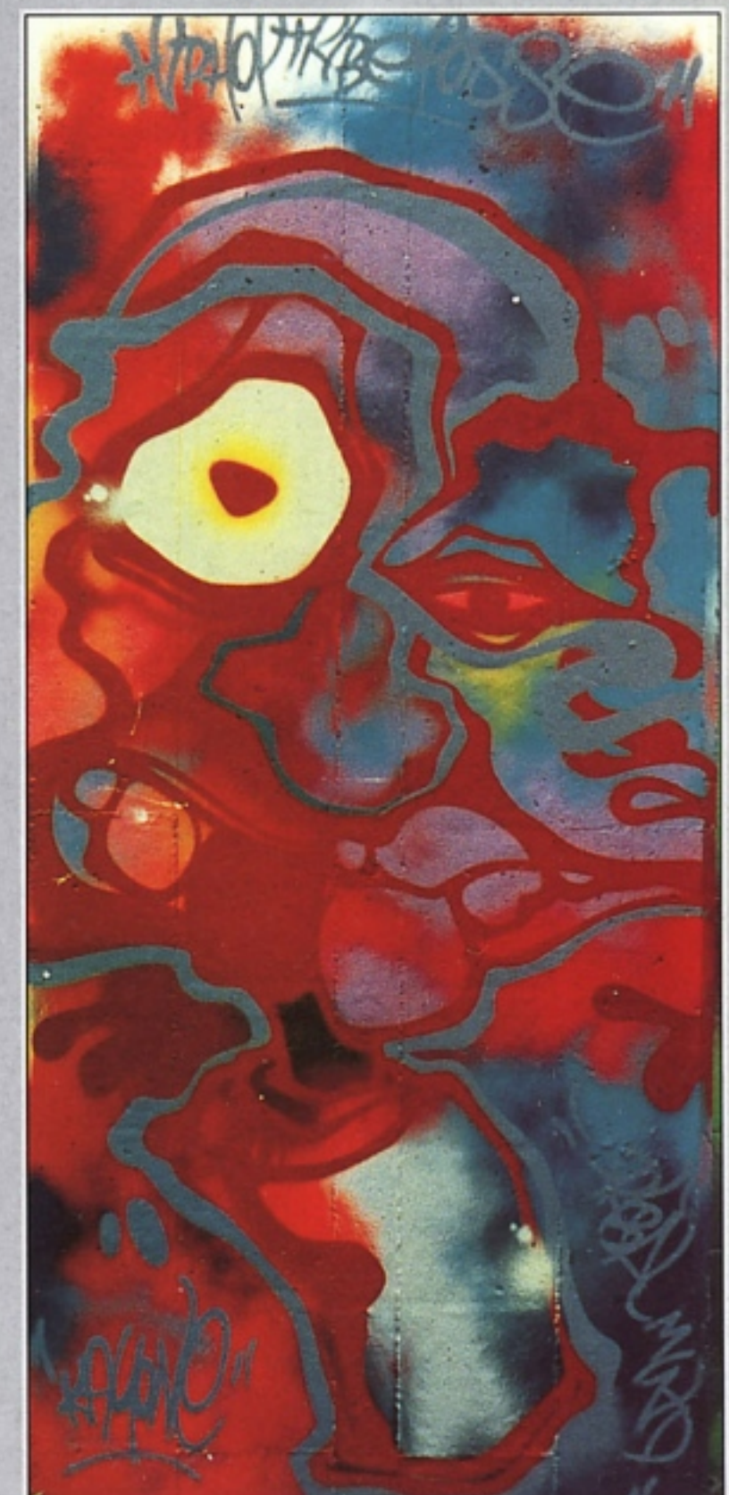
"KAYONE" THP MILANO