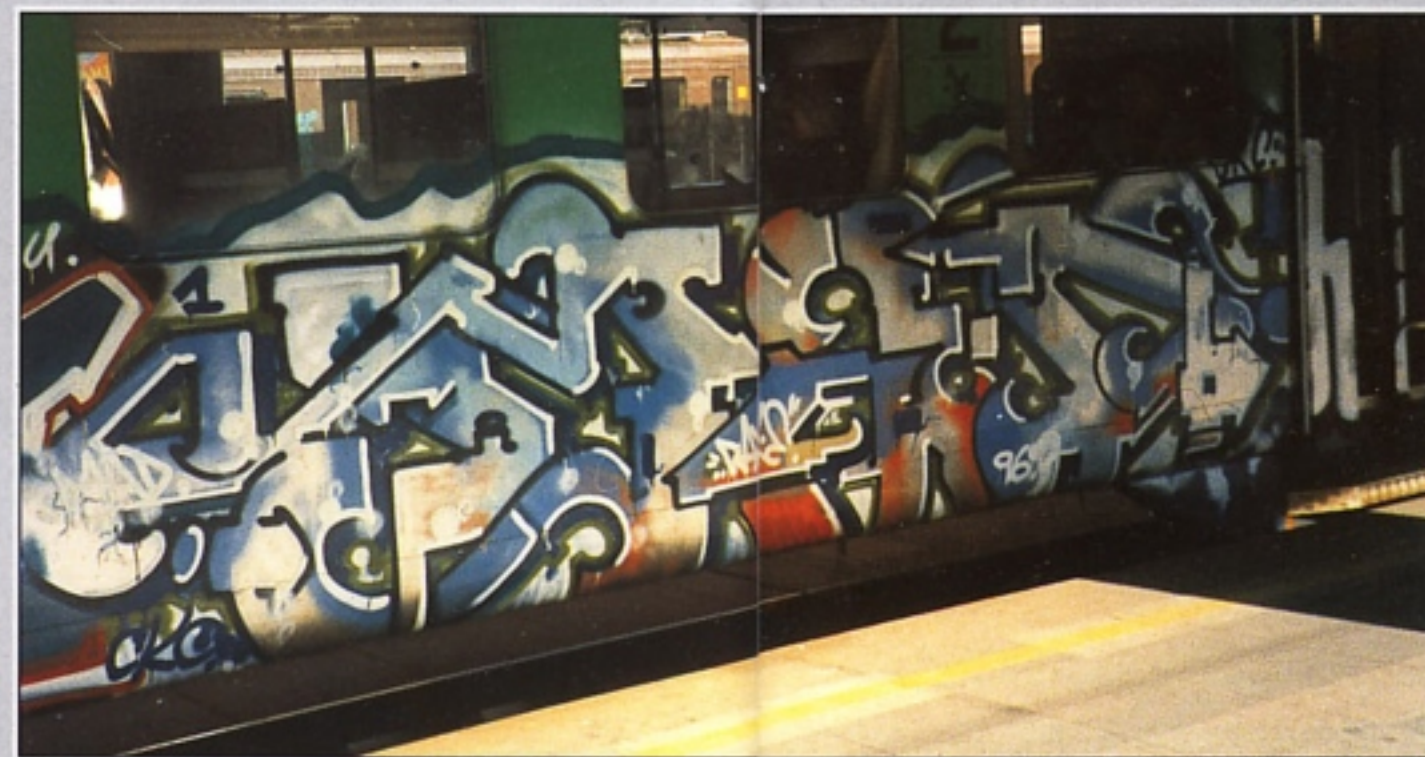
"DROP.C" CKC.IVA.UAN.DCN MILANO