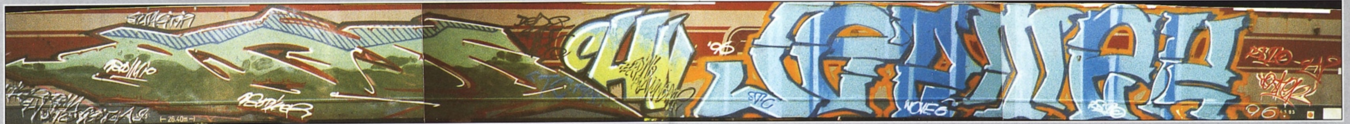
"NEO" TIKER.TNC.CHV + "JESTER" CHV.TNC CREMA