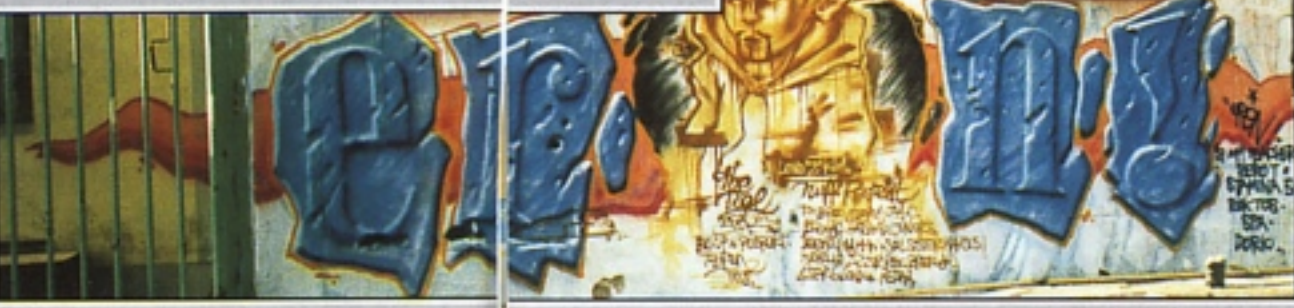
"ZERO T" + "ERON" TCS A PISA