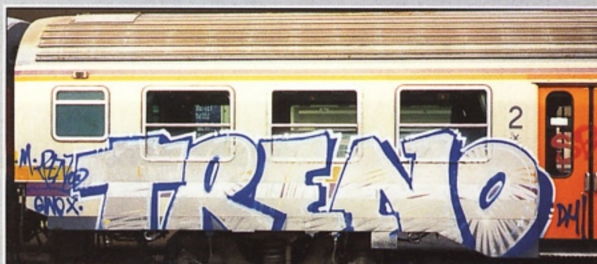
"TRENO" DH BOLOGNA