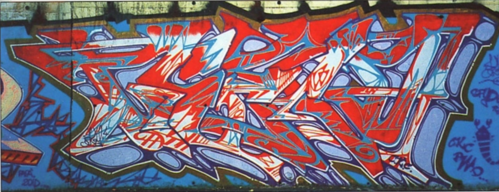
"SKY.4" CKC.PWD MILANO '95