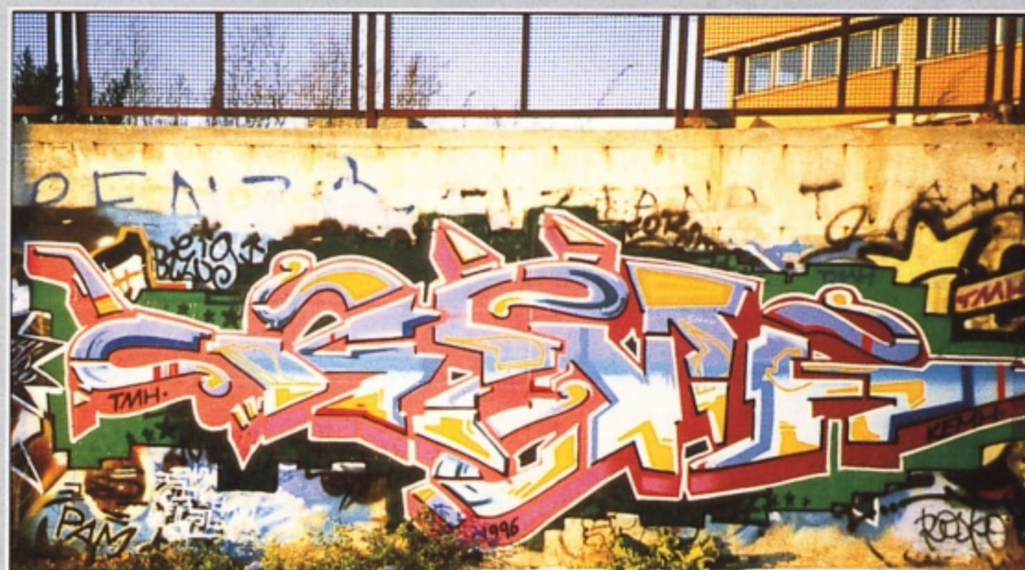
"KEMH" TMH ROMA