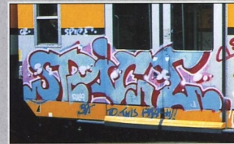
"SPICE" GR MILANO