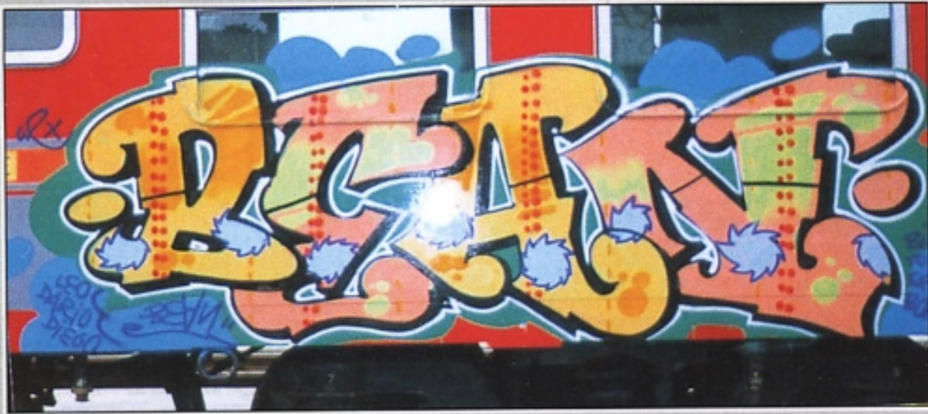
"BIN2" GR.TAK MILANO