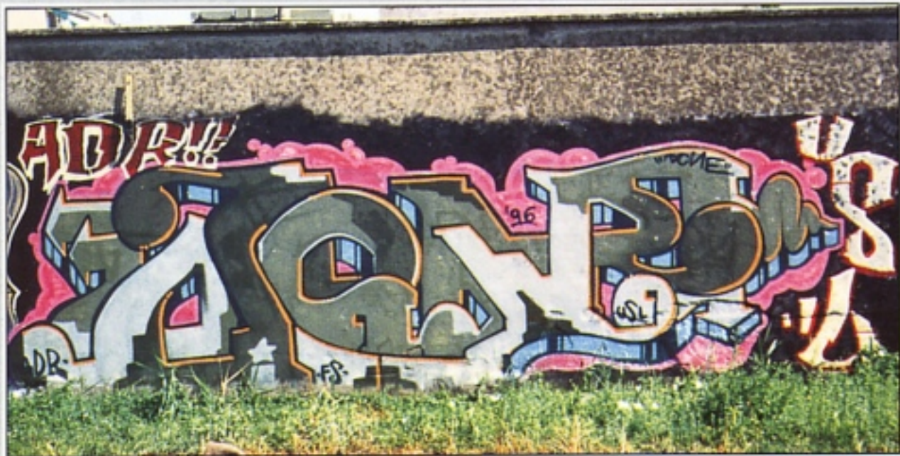
"DONE" ADR CESENA A RIMINI