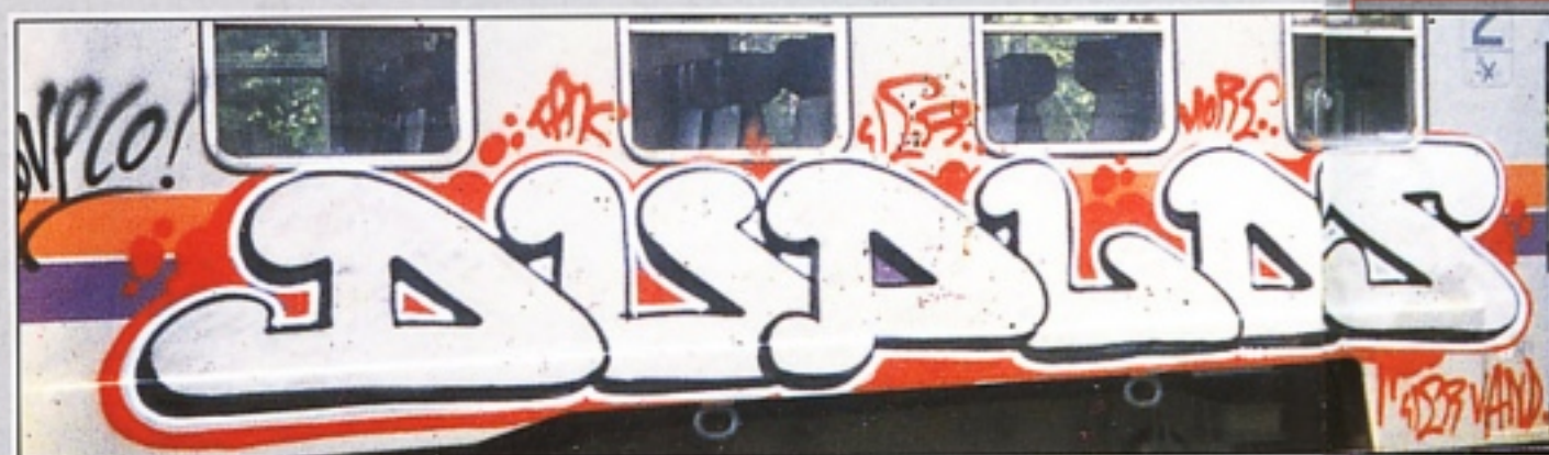
"DUPLO" GR.TAK MILANO