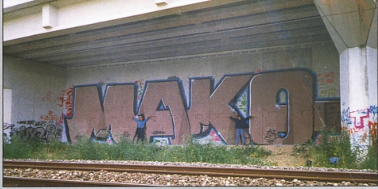
"CANZ" . "NITRO" memorial MAKO ROMA