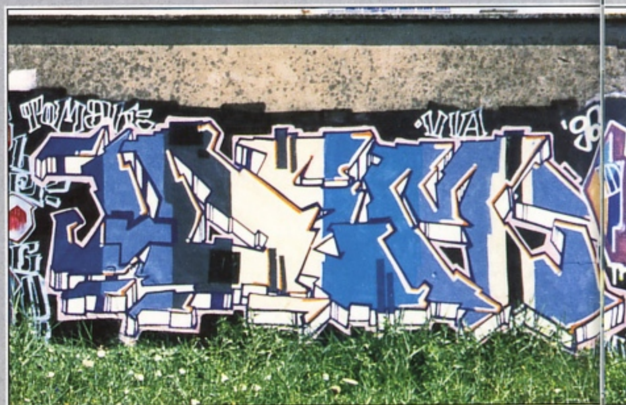
"TOMAK" VIA GROSSETO A RIMINI