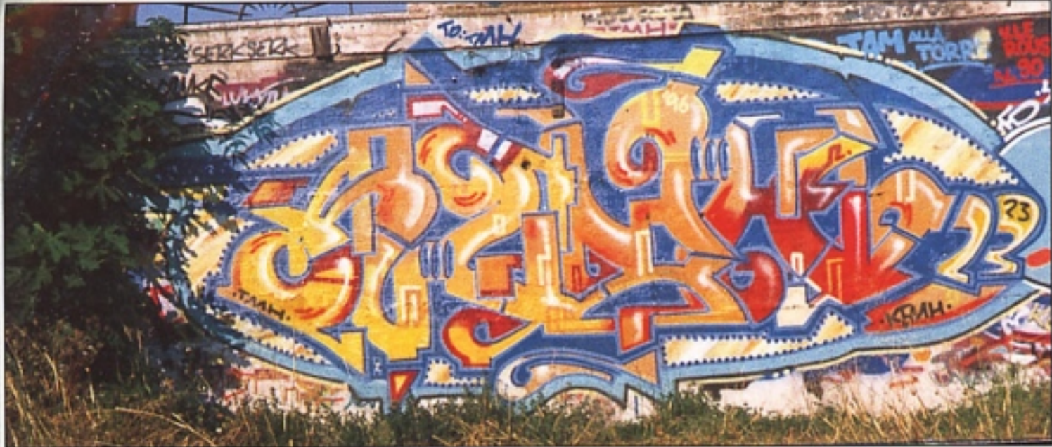
"KEMH" TMH ROMA