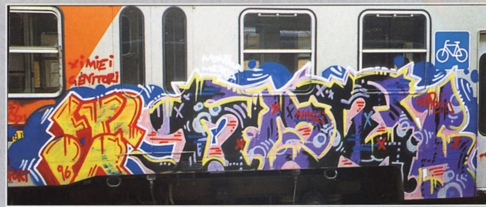
"ENIST" FTR.PR FIRENZE