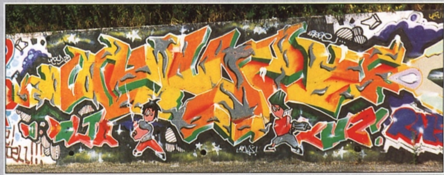
"WOZE" RNS MILANO A HIPOTA