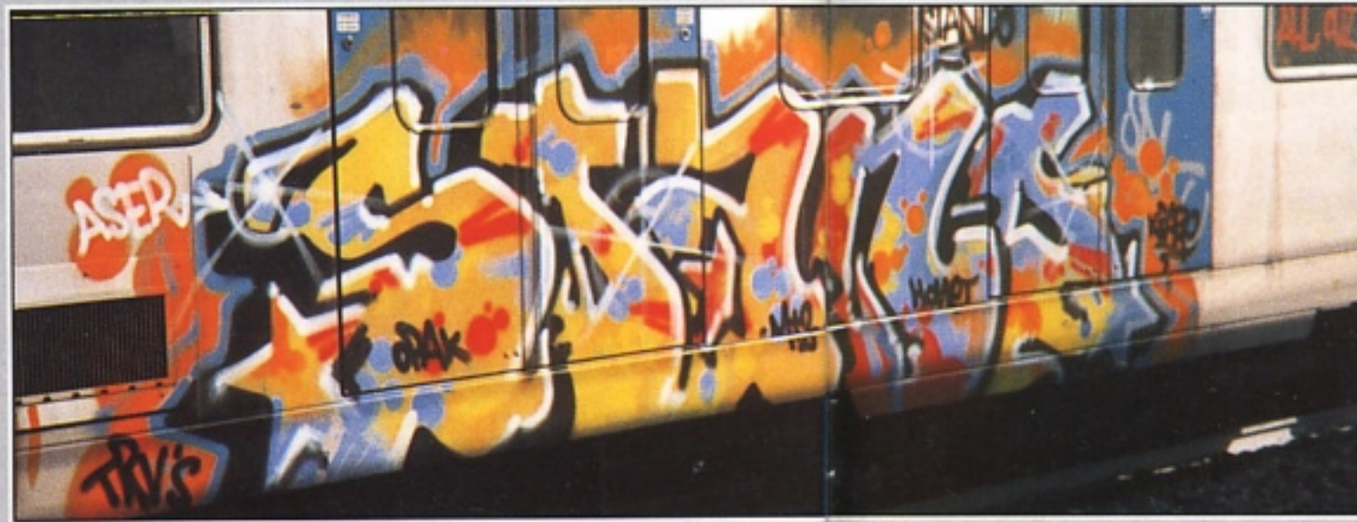
"STAND" MT2 ROMA