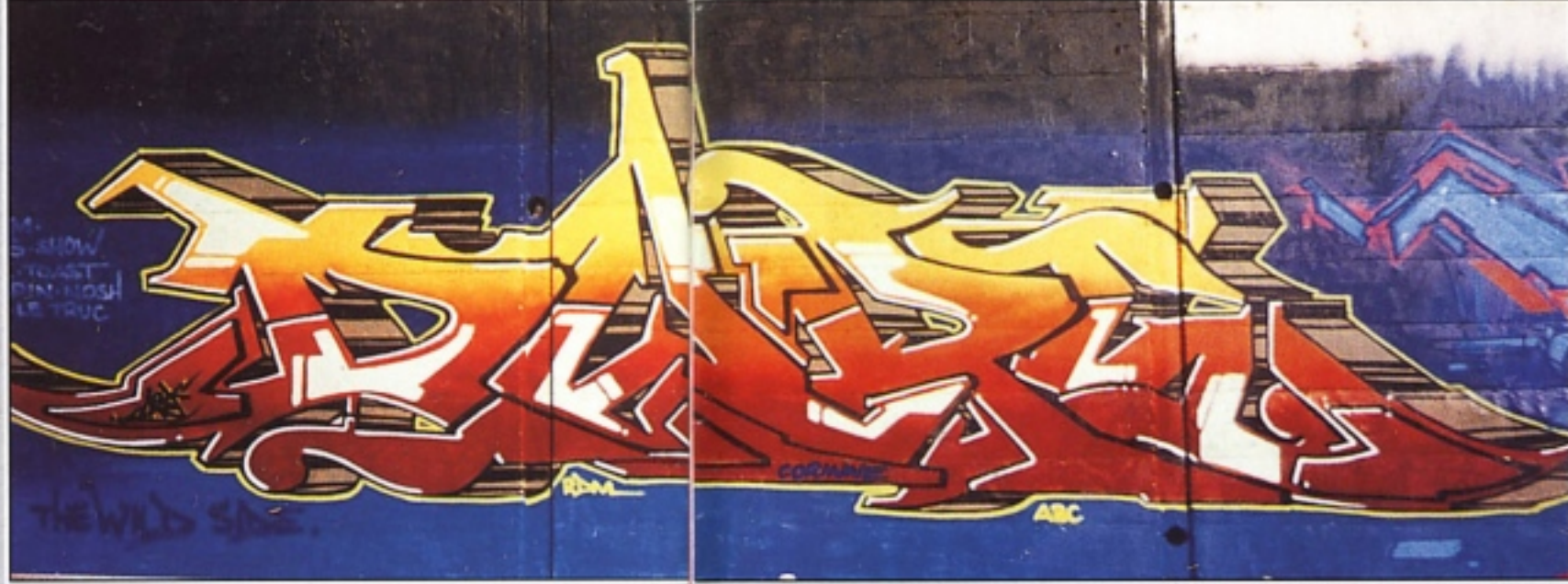
"DARE" TWS BASILEA A JUICE