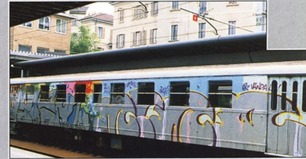
"WAEZE" RNS + "MIND" TAK - GR MILANO