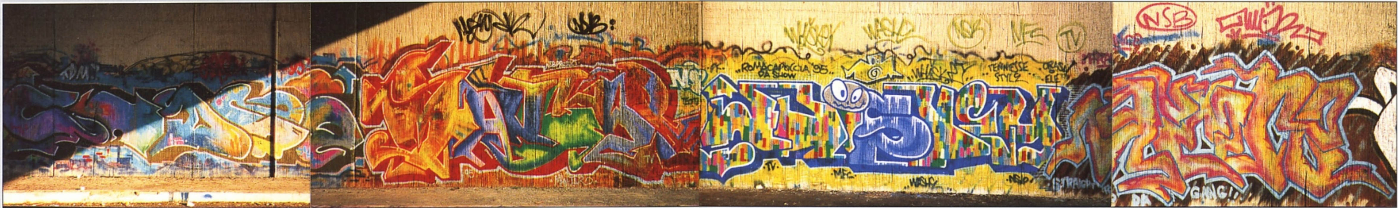
"NSB CREW" ROMA