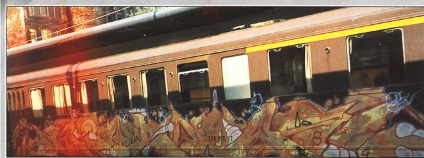
"TAWA" + "CANO" 16K MILANO