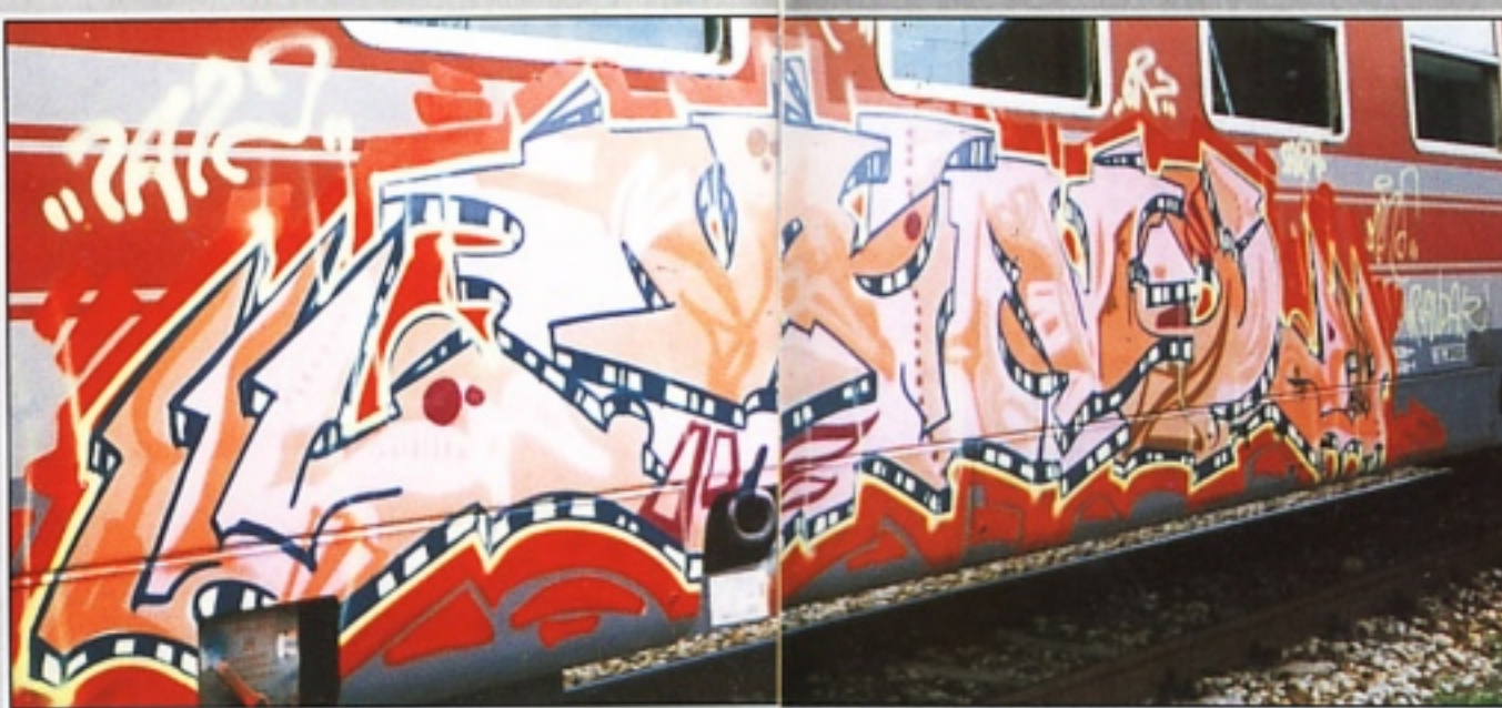
"MIND" TAK.GR MILANO