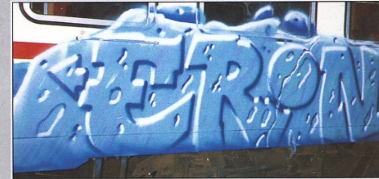
"ERON" TCS RIMINI