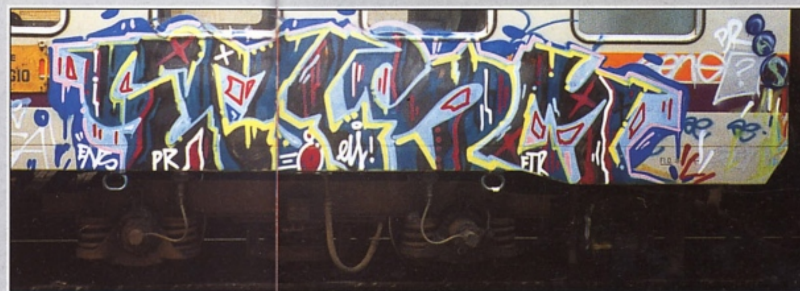
"DORK" FTR.PR BOLOGNA