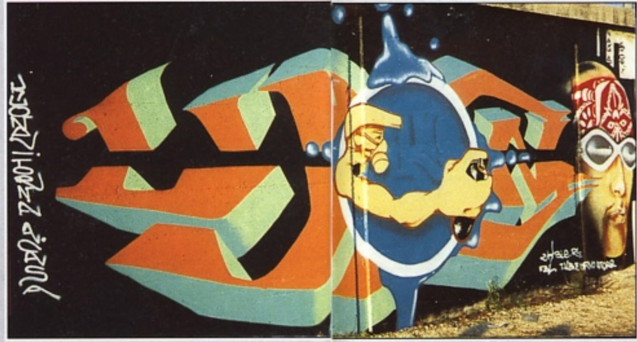
"LEO" BAP BRESCIA A JUICE