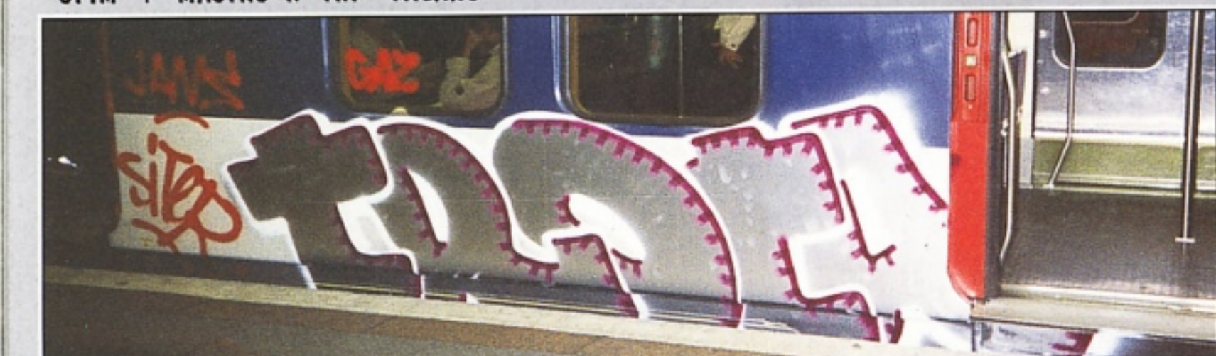
"TROTA" PAC ROMA LINEA RER PARIGI