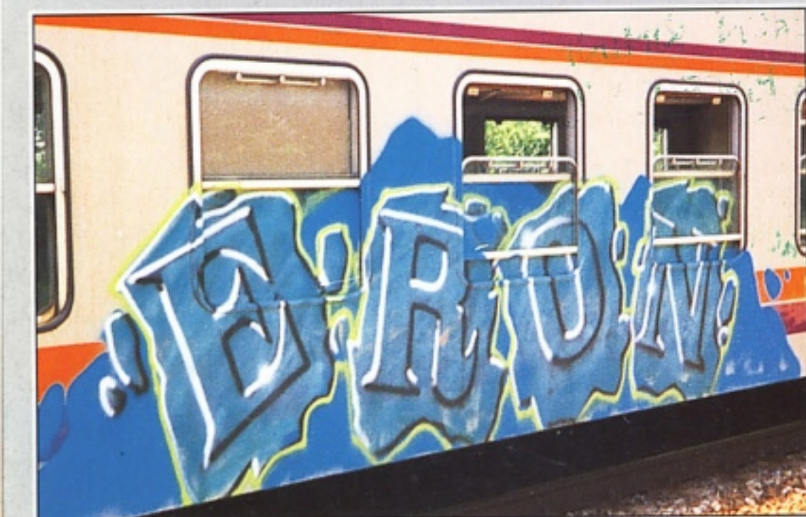
"ERON" TCS RIMINI