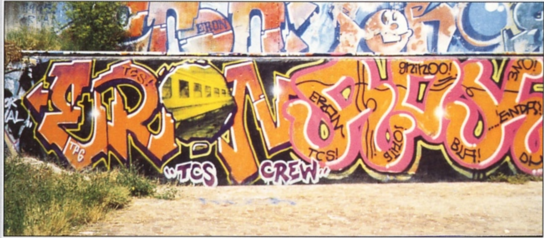
"ERON" + "ROK" TCS RIMINI