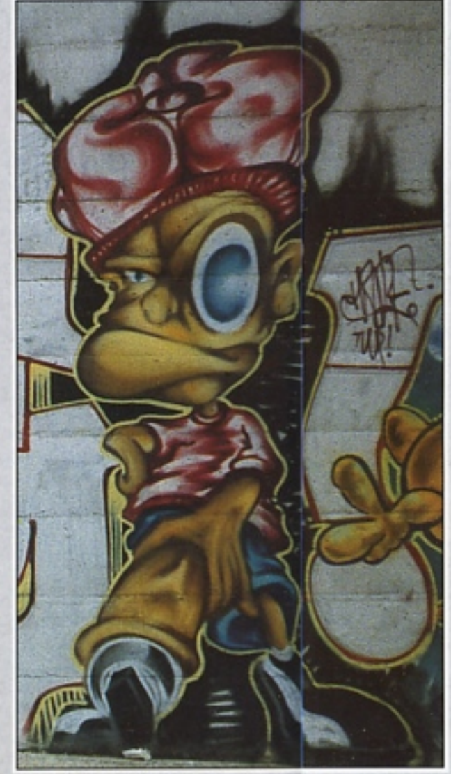
"HATE" TWP A JUICE '96