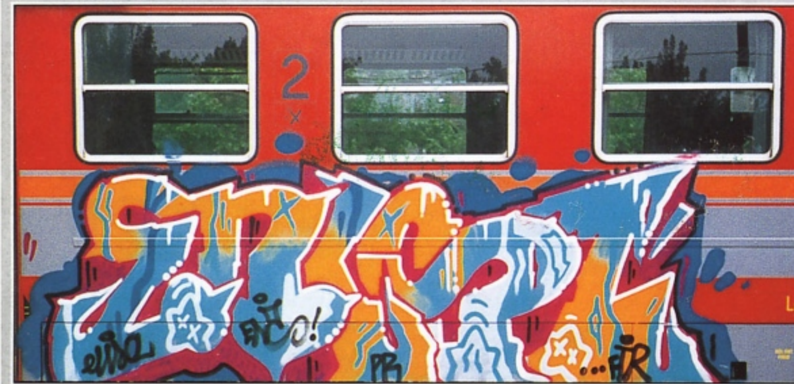
"ENIST" FTR.PR FIRENZE