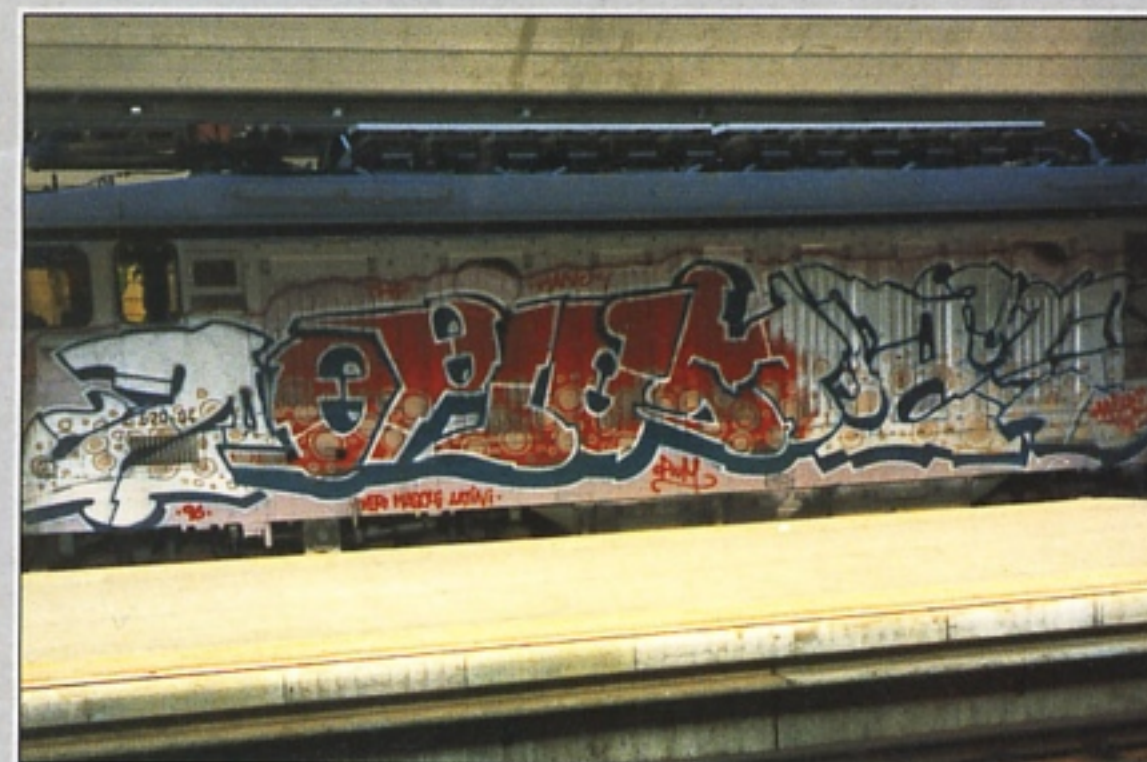
"MASTRO.K" SIC.THP VARESE

Questo numero è dedicato a Smash e Mako. R.I.P.