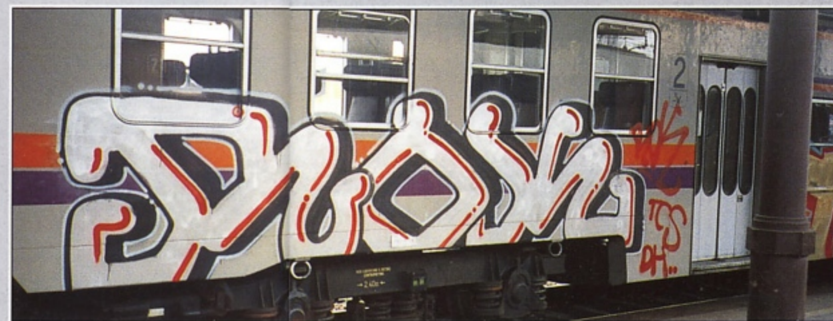
"ROK" TCS PIACENZA