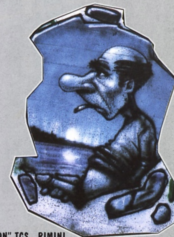
"ERON" TCS RIMINI