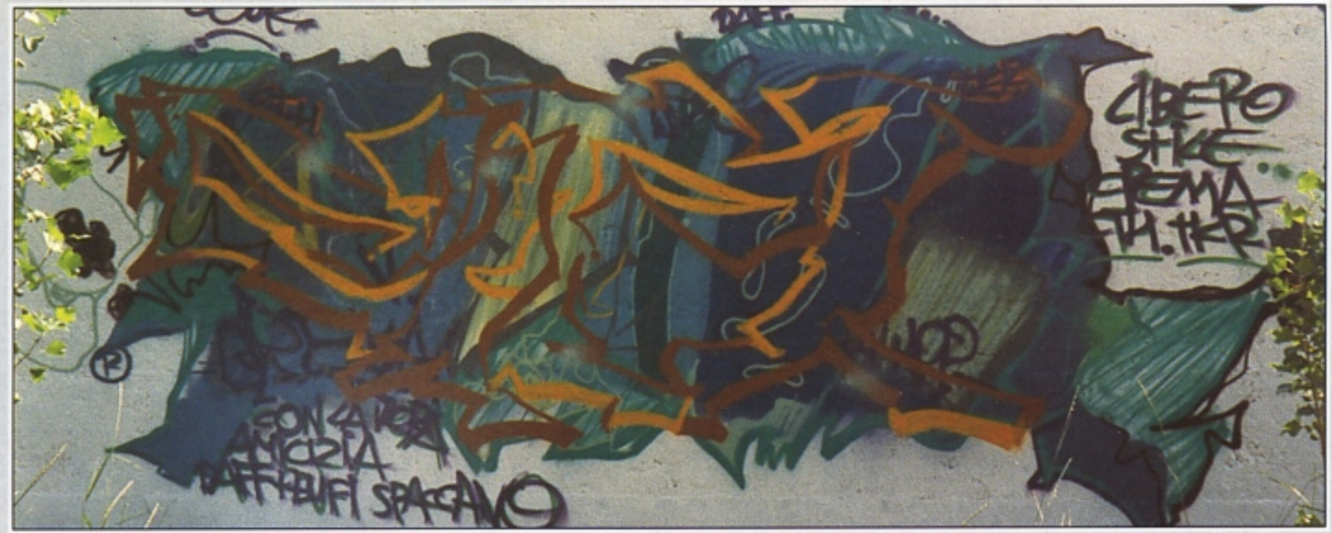
"EUFI" TIKER CREMA