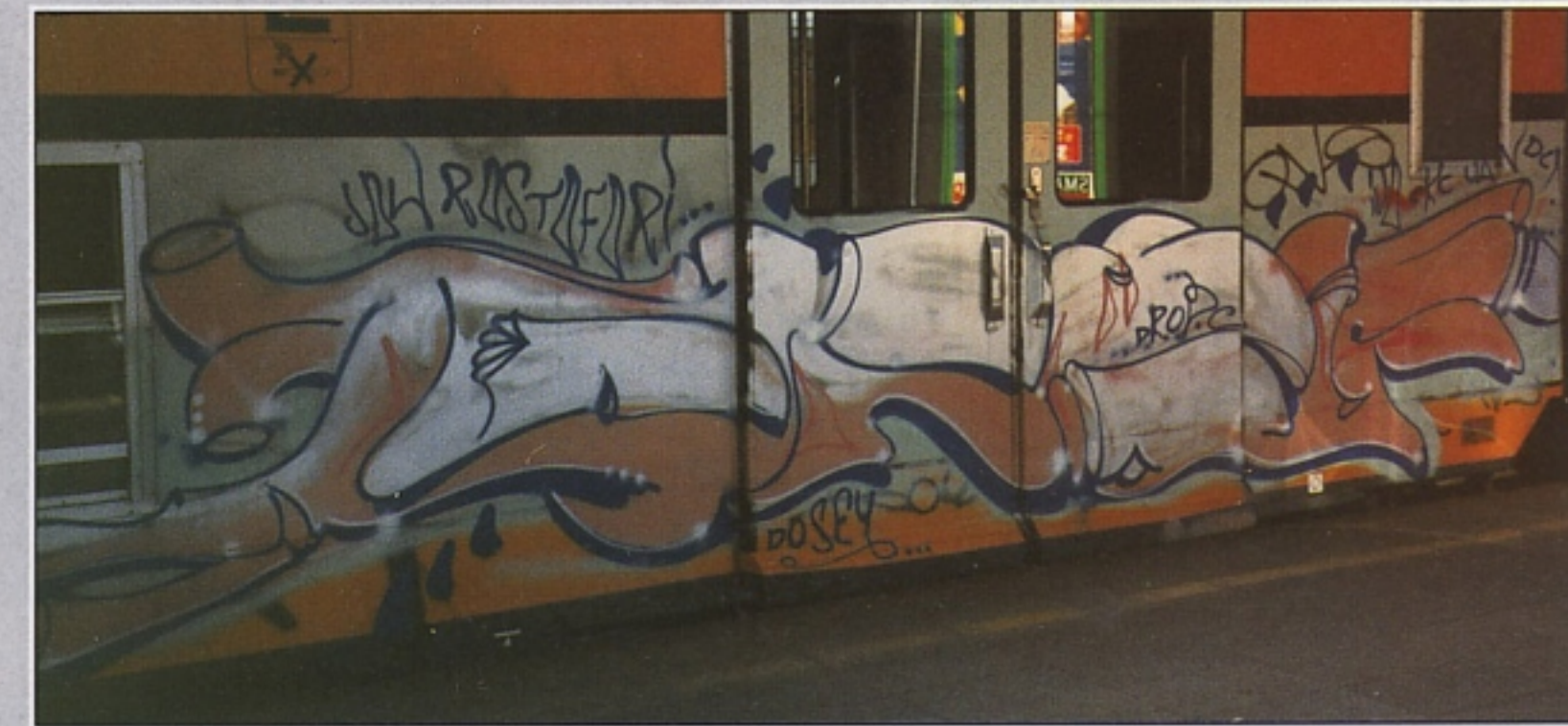
"RAXE" CKC.IVA.UAN MILANO