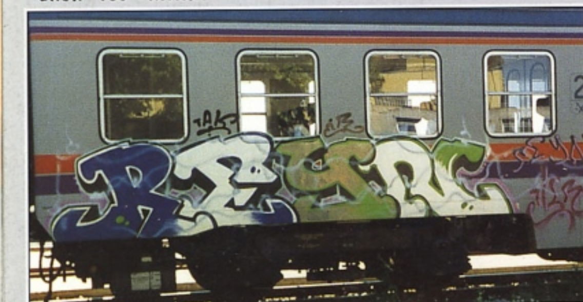
"REYN" TAK.GR MILANO