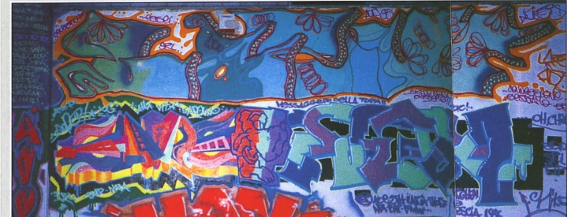
"AZY" + "SAPO" + "DONCHIKO" ADP BERGAMO A BRESCIA '96