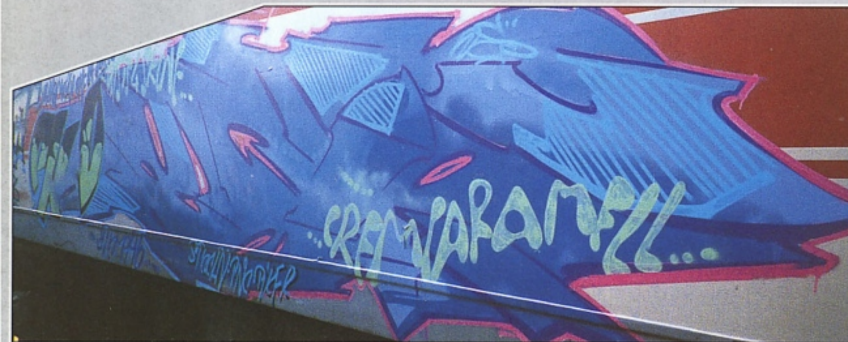
"NEO" TIKER-CHV.TNC CREMA