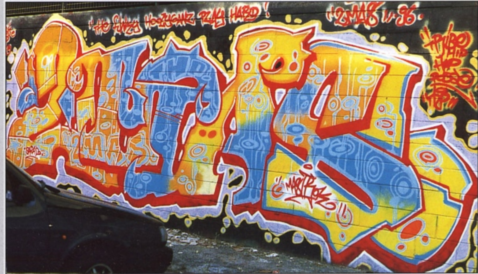
"MASTR K" THP MILANO