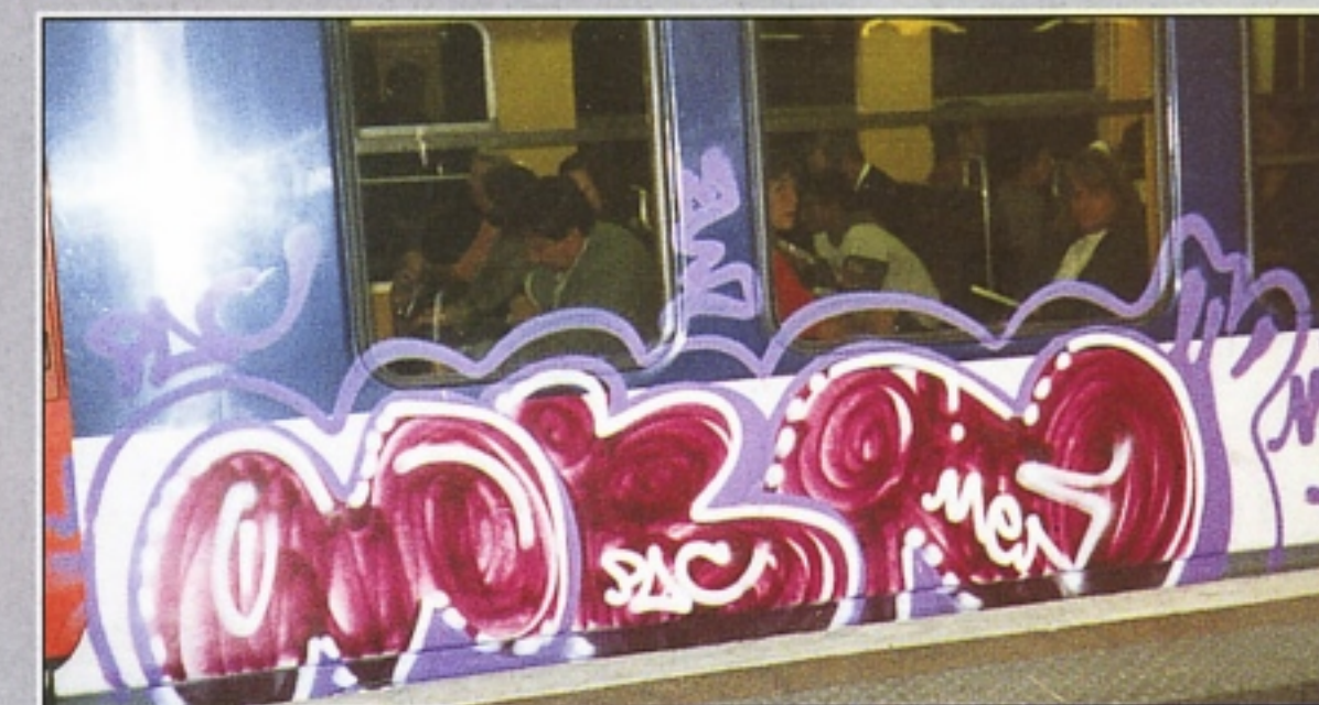
"MENCIO" PAC ROMA LINEA RER PARIGI